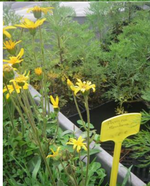
La Grande Gentiane ... L'Arnica Montana

En vous souhaitant d'avoir un jour l'occasion de passer par là !