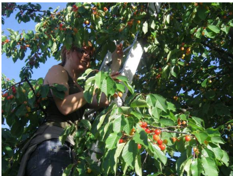
Cueillette des cerises pour l'eau de vie de Kirsch (distillerie)

En passant par...l'Alsace et la Lorraine, au retour de la Foire Eco-Bio de Colmar.