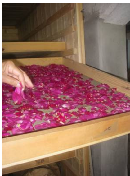
Cultures d'aromatiques et médicinales. Séchoir à claies.