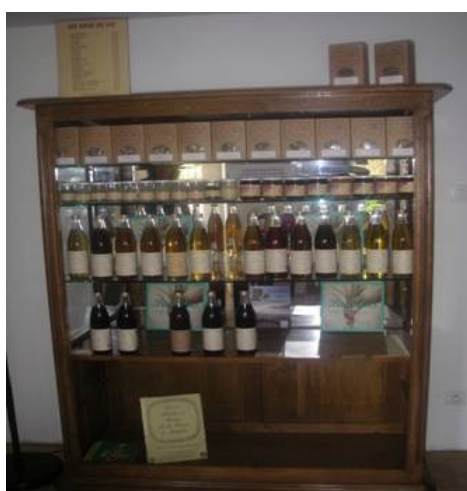
L'atelier de transformation à Kalblin (Confitures, sirops, confits...)